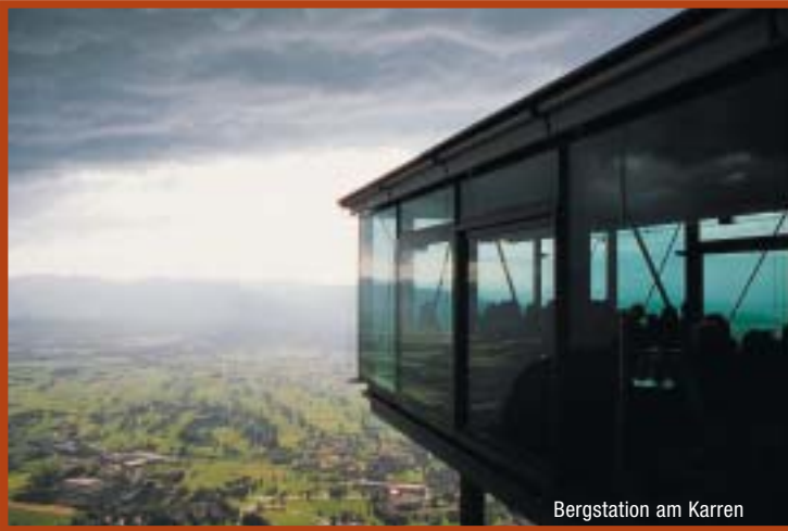
Bergstation am Karren